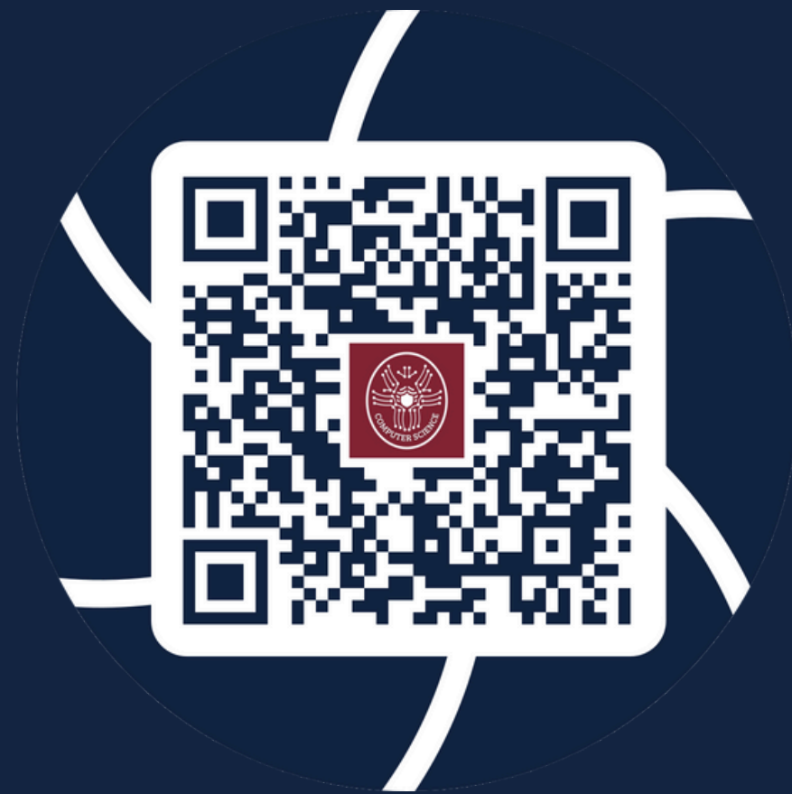
Computer Science (29932)